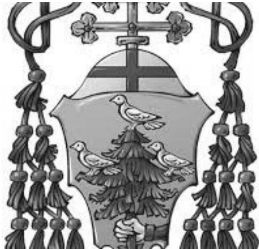
Lo stemma del nuovo arcivescovo

Per muoversi in città, predilige la bicicletta. E quando c'è da pedalare, non chiedetegli di tirarsi indietro. Delpini – che è vescovo ausiliare di Milano e che proprio Scola aveva voluto vicario generale nel 2012 – ne compirà invece 66 a fine mese, essendo nato il 29 luglio 1951.