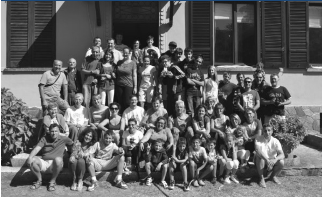
Vacanza con i gruppi famigliari nel 2013

gione per cui la comunità di Limito è considerata dalla Diocesi un po' come una nave scuola per i preti, un luogo dove uno può imparare, perché si sa che qui troverà sostegno e collaborazione. E' la ragione per cui sono stati mandati preti sotto i 50 anni, cosa non così comune nelle altre realtà. Questa caratteristica di Limito è un suo pregio e io spero che sia mantenuta e incoraggiata questa fisionomia di cristiani normali che sanno fare bene il loro compito di cristiani. E allo stesso tempo auguro a questa comunità di tenere un orizzonte ampio, di guardare oltre lo spazio della parrocchia e cogliere le occasioni per confrontarsi con altre realtà, contesti nuovi, esperienze grandi che fanno crescere.