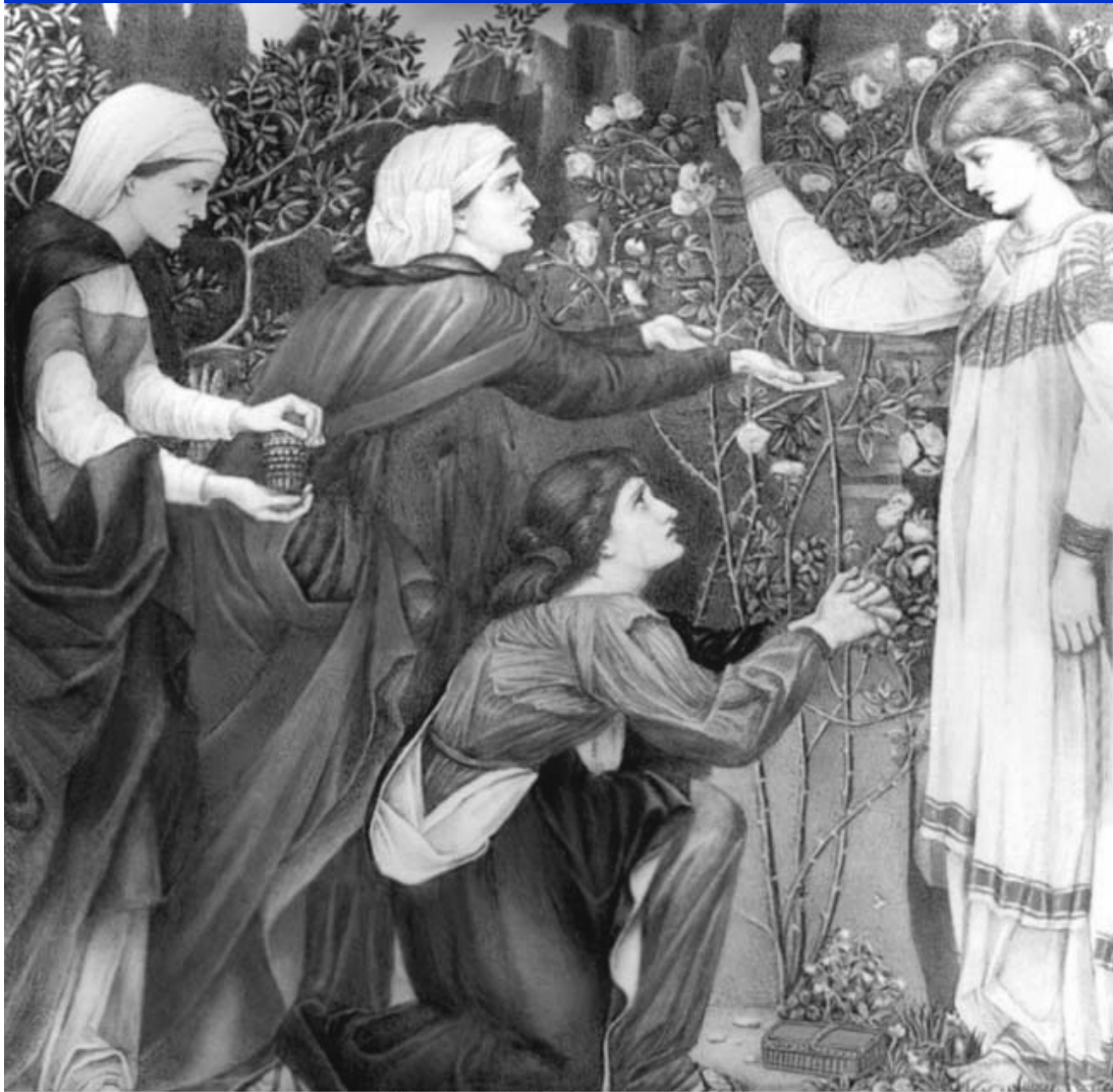
A.C. Lalli, Le tre Marie al Sepolcro , XIX sec.

"Perché cercate tra i morti colui che è vivo? Non è qui, è risorto." ( Lc. 24,6 )